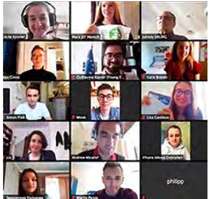
Kleiner Ausschnitt von unserem Webinar.